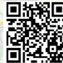
Fahrplan der Linie 118

Geobasisdaten: Bayerische Vermessungsverwaltung 785/17