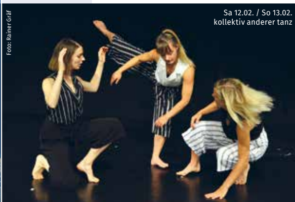
Sa 12.02. / So 13.02. kollektiv anderer tanz