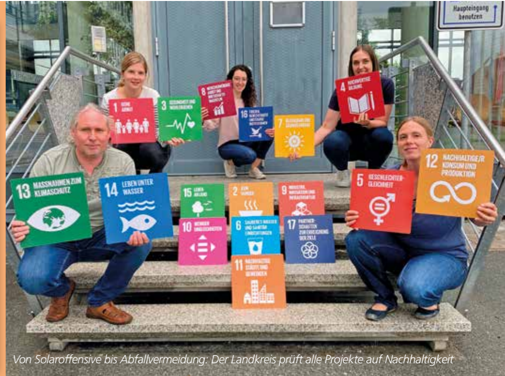
Von Solaroffensive bis Abfallvermeidung: Der Landkreis prüft alle Projekte auf Nachhaltigkeit

Auf einer neuen Homepage des Landkreises Fürth werden aktuelle Projekte zum Thema Nachhaltigkeit sowie die Entwicklungen bei der Nachhaltigkeitsstrategie ausführlich und informativ dargestellt. In diesem Bereich hat sich in den vergangenen Monaten sehr viel getan, denn nachhaltige Entwicklung ist eine zentrale Zukunftsaufgabe für den Landkreis Fürth.